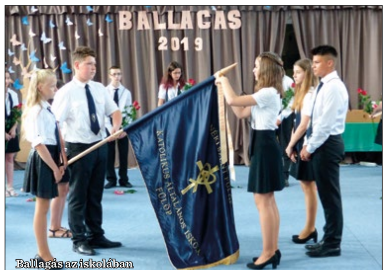
Ballagás az iskolában