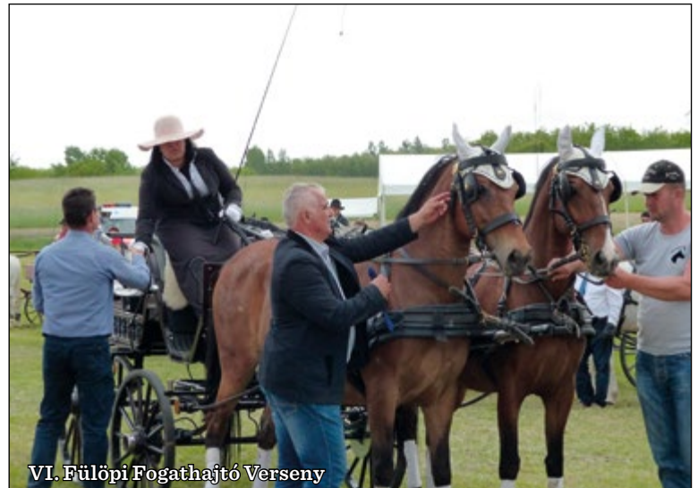
VI. Fülöpi Fogathajtó Verseny