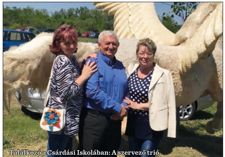
Találkozó a Csárdási Iskolában: A szervező trió