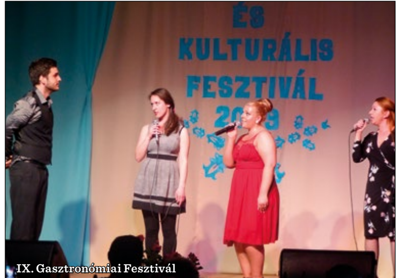
IX. Gasztronómiai Fesztivál