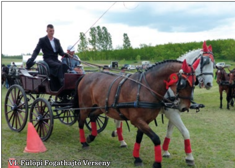
VI. Fülöpi Fogathajtó Verseny