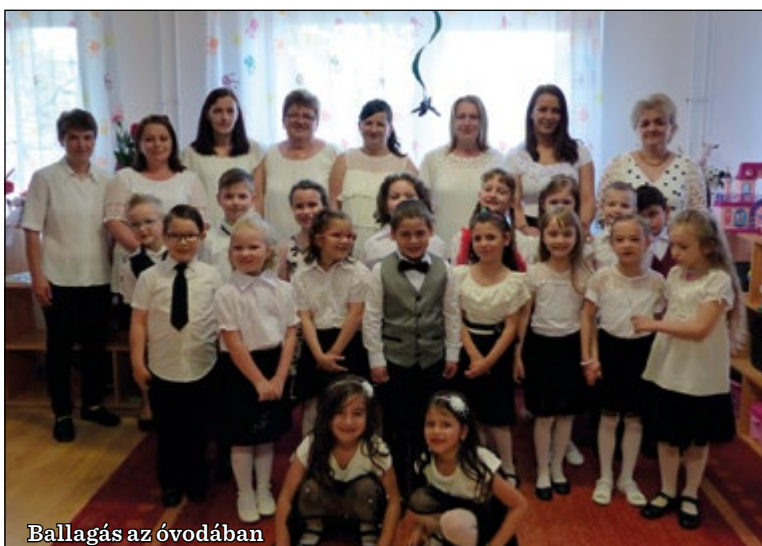
Ballagás az óvodában