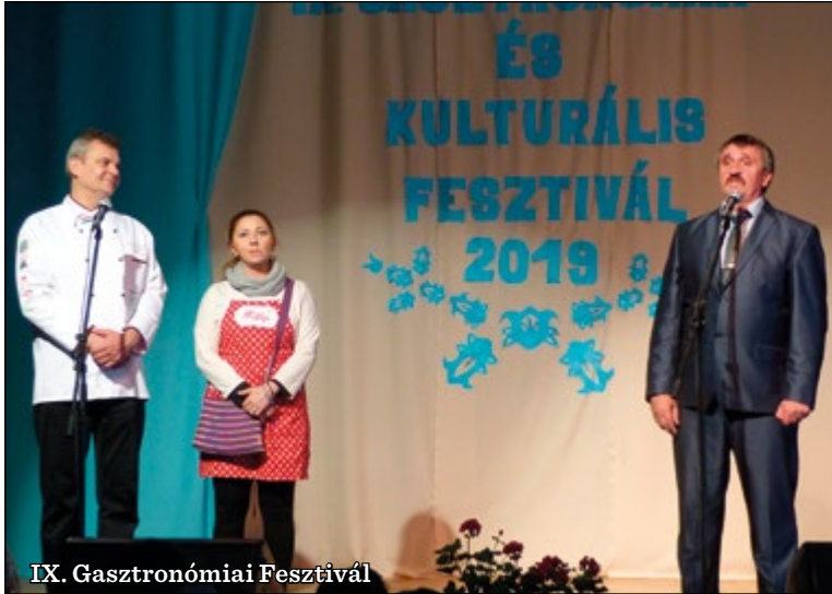
IX. Gasztronómiai Fesztivál