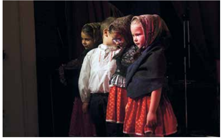
Községi Karácsonyi Ünnepség – Fülöpi óvodások