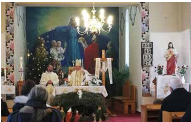
Püspöki szentmise a fülöpi római katolikus templomban