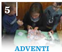
5 ADVENTI KÉSZÜLŐDÉS