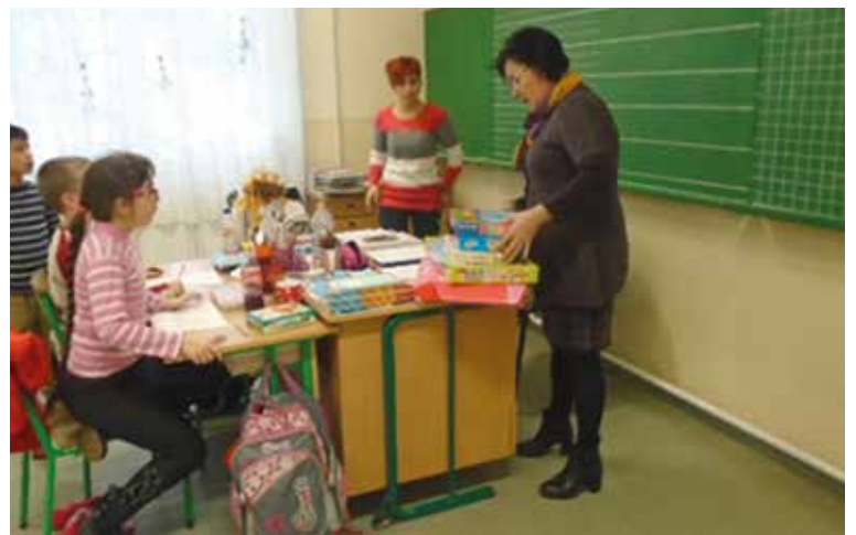
A Magyar Vöröskereszt Debreceni Szervezetének adományai