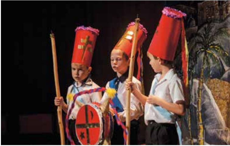
Községi Karácsonyi Ünnepség – A Néri Szent Fülöp Katolikus Általános Iskola diákjai