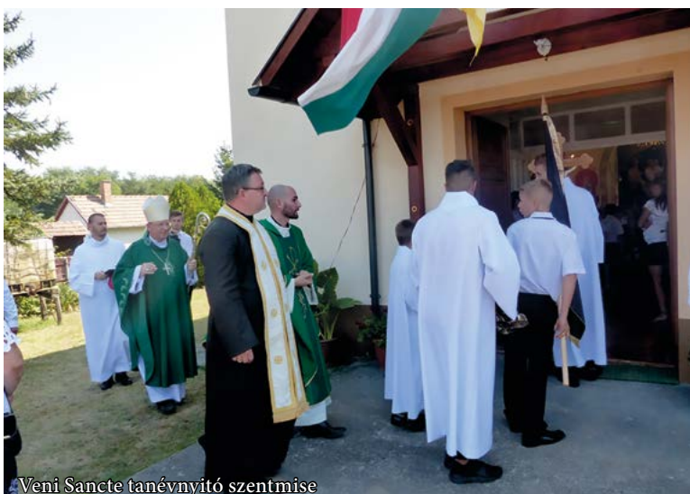
Veni Sancte tanévnyitó szentmise