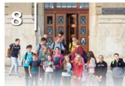
8 KUTATÓK ÉJSZAKÁJA 2019