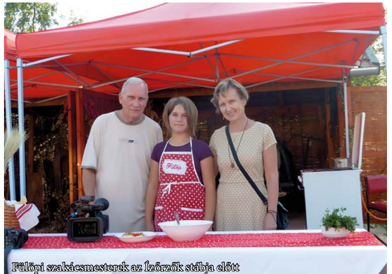
Fülöpi szakácsmesterek az Ízörzök stábjá előtt