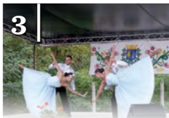
3 A BÁNHÁZI KÁPOLNA BÚCSÚJA