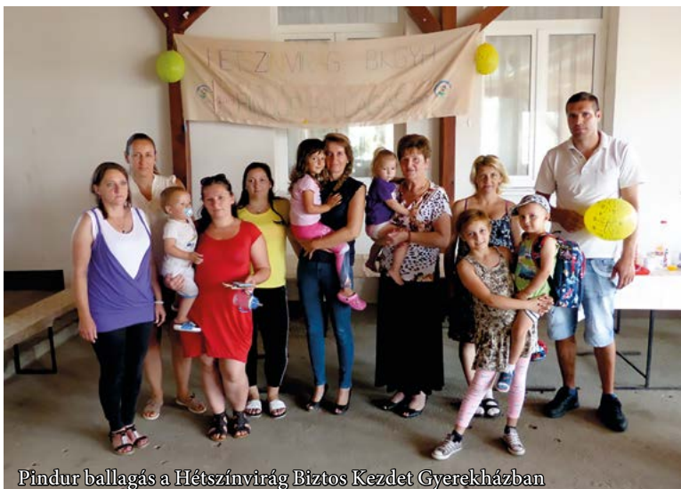
Pindur ballagás a Hétszínvirág Biztos Kezdet Gyerekházban