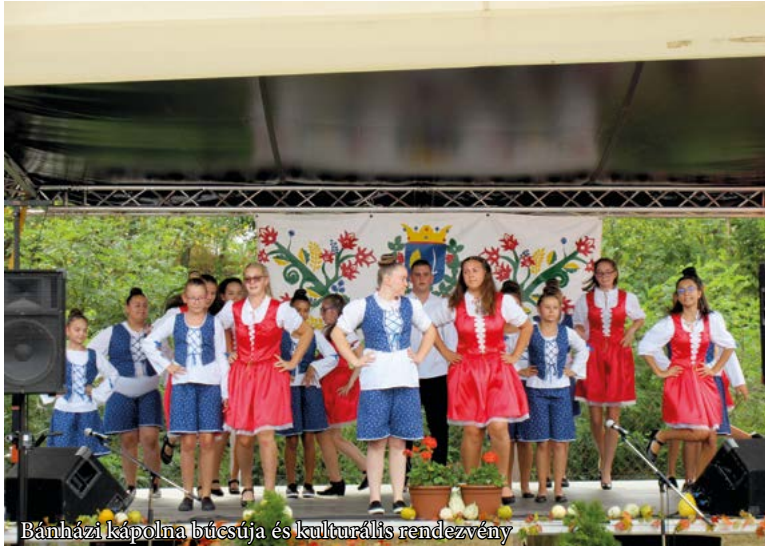
Bánházi kápolna búcsúja és kulturális rendezvény