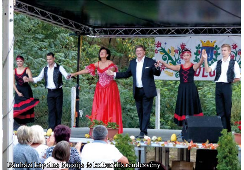
Bánházi kápolna búcsúja és kulturális rendezvény