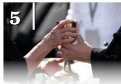
5 ÉN IS MEGYEK