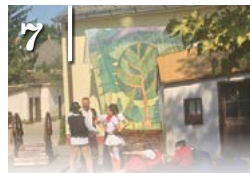
7 LÚDAS MATYI ELŐADÁS