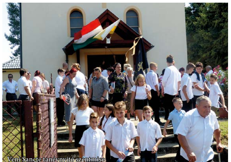
Veni Sancte tanévnyitó szentmise