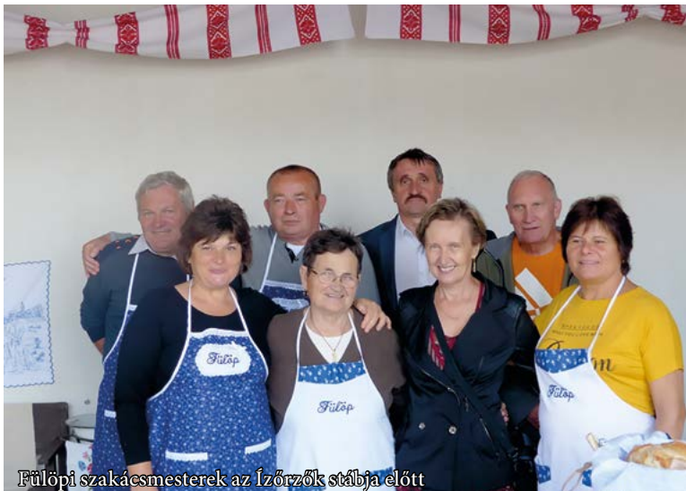
Fülöpi szakácsmesterek az Ízörzök stábjá előtt