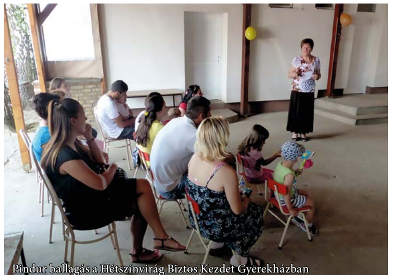
Pindur ballagás a Hétszínvirág Biztos Kezdet Gyerekházban