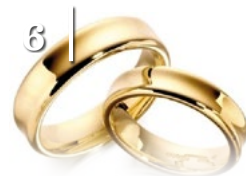
6 ARANY- LAKODALOM