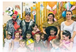
3 FARSANG AZ ÓVODÁBAN