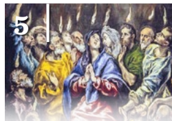
5 PÜNKÖSD ÜNNEPÉRE