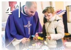
4 HÚSVÉTI KÉSZÜLŐDÉS