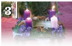
3 ADVENTI ÜNNEPSÉG