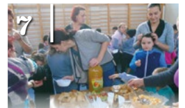
7 EGÉSZSÉG- NAP