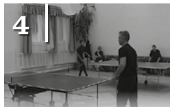
4 ASZTALITENISZ KUPA