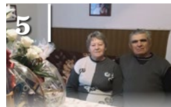
5 ARANY- LAKODALMAK