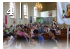
4 ZARÁNDOKOK FÜLÖPÖN