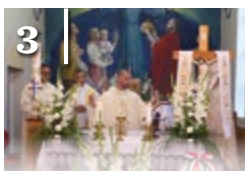
3 AUGUSZTUS 20.