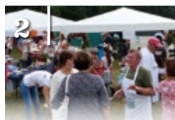
2 TÖK-JÓ DINNYE FESZTIVÁL