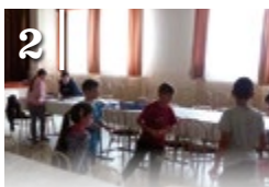
2 HITTANOSOK KÖZSSÉGBEN