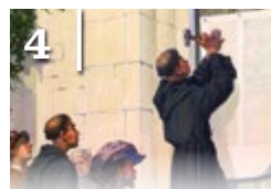
4 500 ÉVE REFORMÁCIÓ