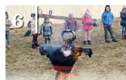
6 TÉLÜZÉS AZ ÓVODÁBAN