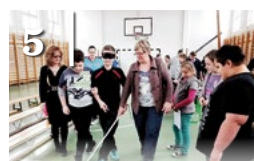
5 TOLERANCIA NAP