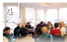
4 KIRÁNDULT A NYUGDÍJAS KLUB