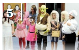
5 FARSANG AZ ISKOLÁBAN