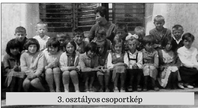
3. osztályos csoportkép

mi történt velük az elmúlt 45 évben. Elmondhatatlan érzés, hogy tanáraikkal mindenről tudtunk beszélgetni. Régi kis titkainkat felfedtük és kitárgyaltuk. Volt itt öröm, kacagás és szem nem maradt szárazon, hol a boldogságtól, hol a meghitt pillanatoktól. Óriási feltöltődés volt ez mindannyiunk számára és abban maradtunk, hogy az 50 éves évfordulónkat is megszervezzük! Bízom benne, hogy az Isten