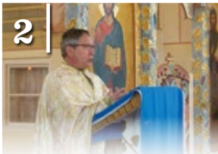
2 GÖRÖGKATOLIKUS TEMPLOMBÚCSÚ