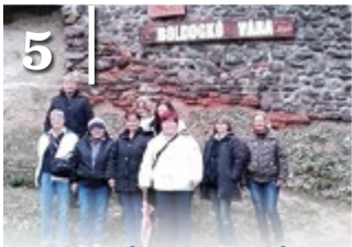
5 KIRÁNDULÁS A ZEMPLÉNBEN