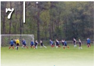
7 EREDMÉNYES SZEZONZÁRÁS