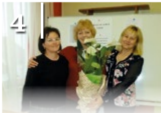
4 A MAGYAR NYELV NAPJA