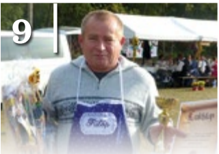
9 SZÜRETI SOKADALOM