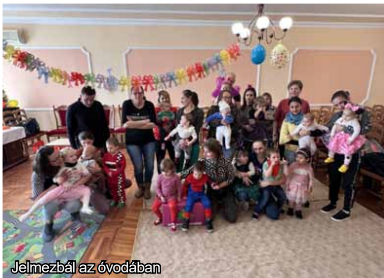
Jelmezbál az óvodában