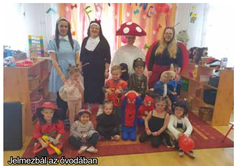
Jelmezbál az óvodában