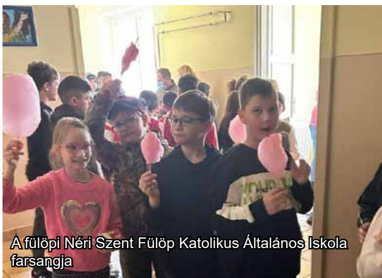
A fülöpi Néri Szent Fülöp Katolikus Általános Iskola farsangja