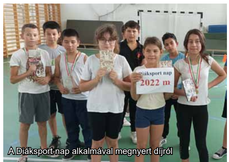
A Diáksport nap alkalmával megnyert díjról