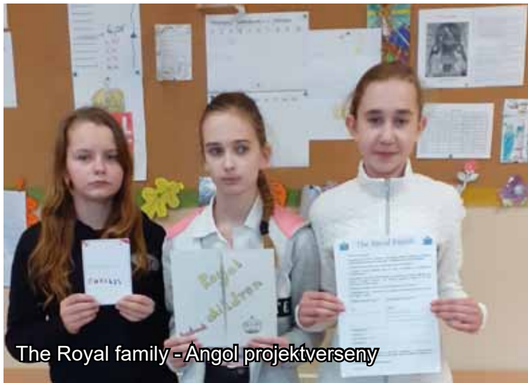
The Royal family - Angol projektverseny