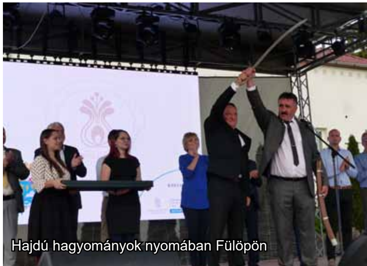
Hajdú hagyományok nyomában Fülöpön