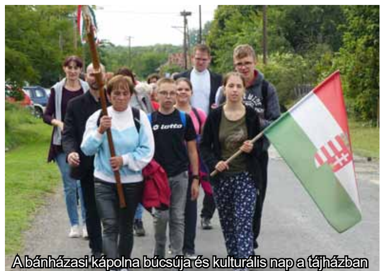
A bánházasi kápolna búcsúja és kulturális nap a tájházban