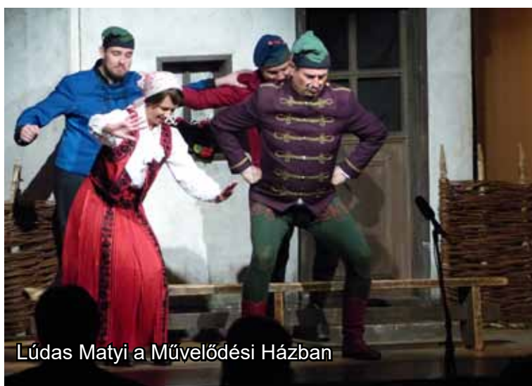
Lúdas Matyi a Művelődési Házban