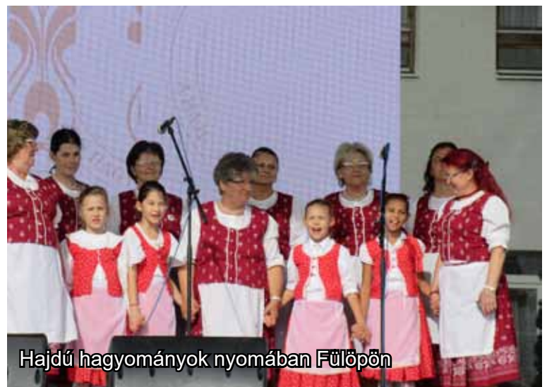
Hajdú hagyományok nyomában Fülöpön