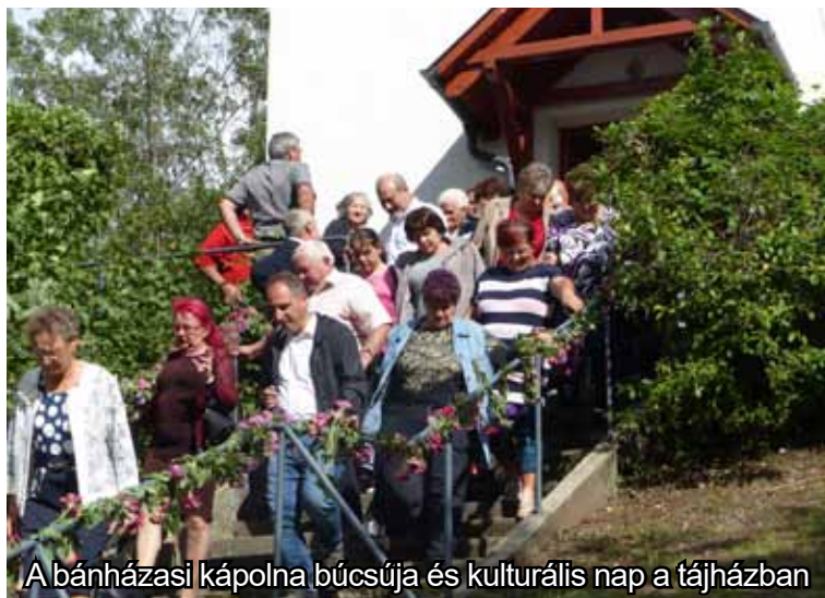
A bánházasi kápolna búcsúja és kulturális nap a tájházban