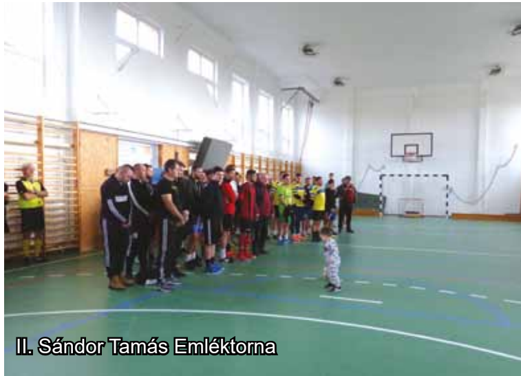
II. Sándor Tamás Emléktorna