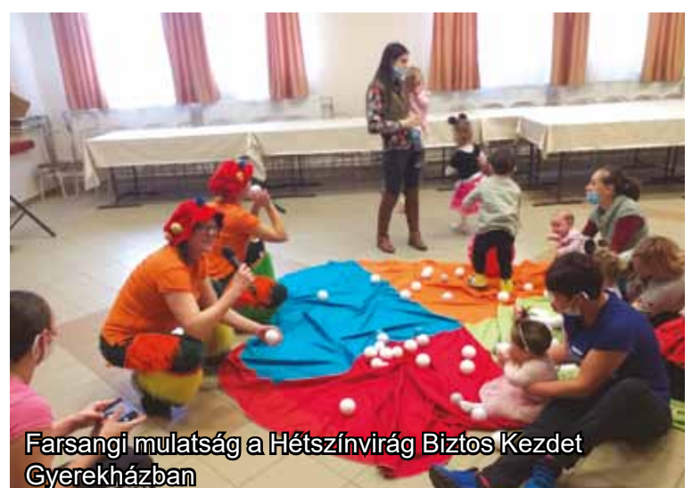
Farsangi mulatság a Hétszínvirág Biztos Kezdet Gyerekházban