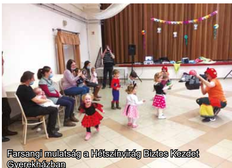
Farsangi mulatság a Hétszínvirág Biztos Kezdet Gyerekházban