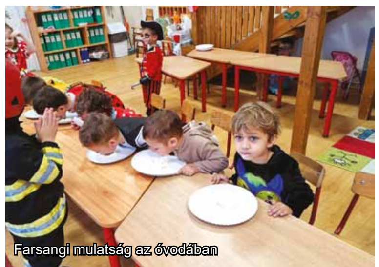
Farsangi mulatság az óvodában