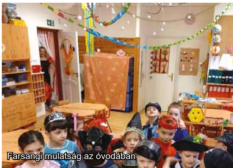
Farsangi mulatság az óvodában