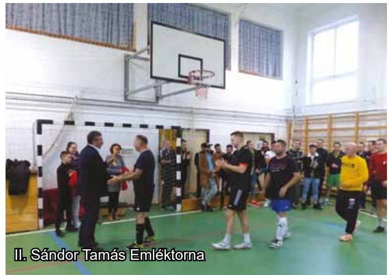
II. Sándor Tamás Emléktorna