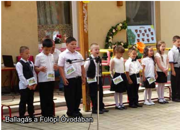
Ballagás a Fülöpi Óvodában