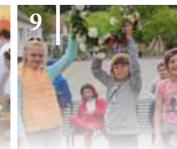
9 NÉRI NAP