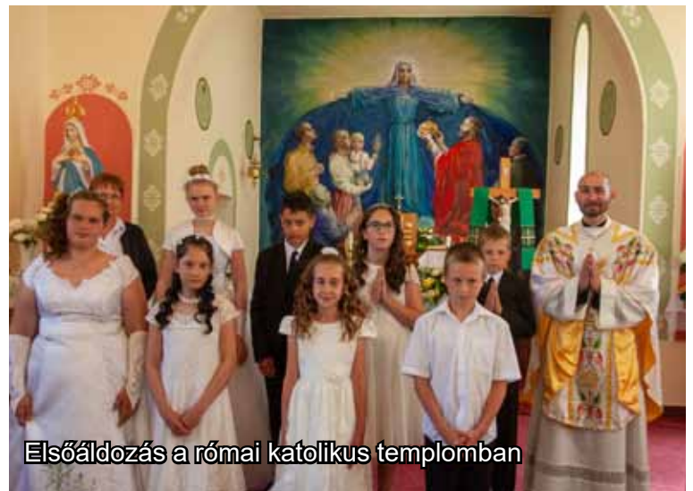
Elsőáldozás a római katolikus templomban