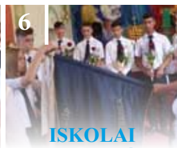
6 ISKOLAI BALLAGÁS